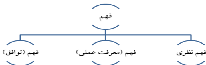
شکل ۲. فهم از دیدگاه گادامر

هرچند گادامر بر این باور است که فهم دارای معانی متفاوتی است ولی او به سه معنای متفاوت فهم اشاره می‌کند که در شکل ۲ نشان داده شده است.