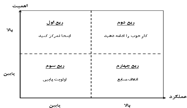
شکل ۱. مدل ربعی تحلیل عملکرد-اهمیت

رویکردهای تحلیل عملکرد- اهمیت به‌وسیله ماتریسی دوبعدی ساختاردهی می‌شود. این ماتریس از دو محور تشکیل شده است که محور X های آن عملکرد و محور Y های آن اهمیت را نشان می‌دهند. این ماتریس، همان‌طور که در شکل (۱) آمده است، به چهار ربع تقسیم می‌شود (الفت و براتی ۱۳۹۱).