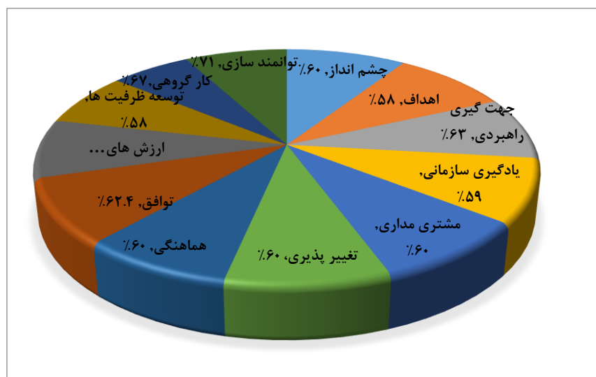
نمودار ۲. شاخص‌های فرهنگ سازمانی در دانشگاه الزهرا